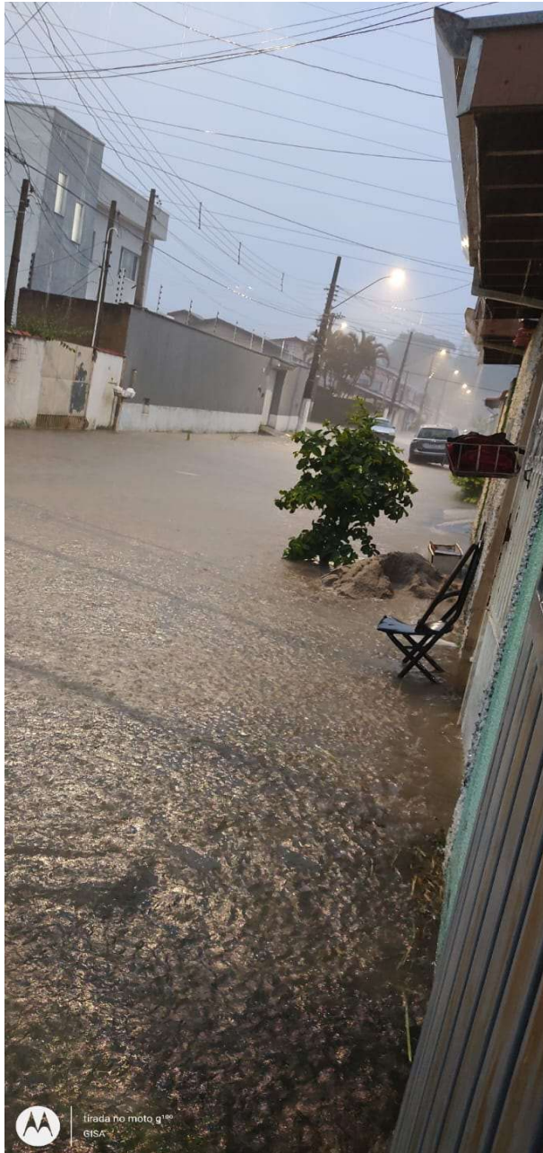
1- Rua Alagada