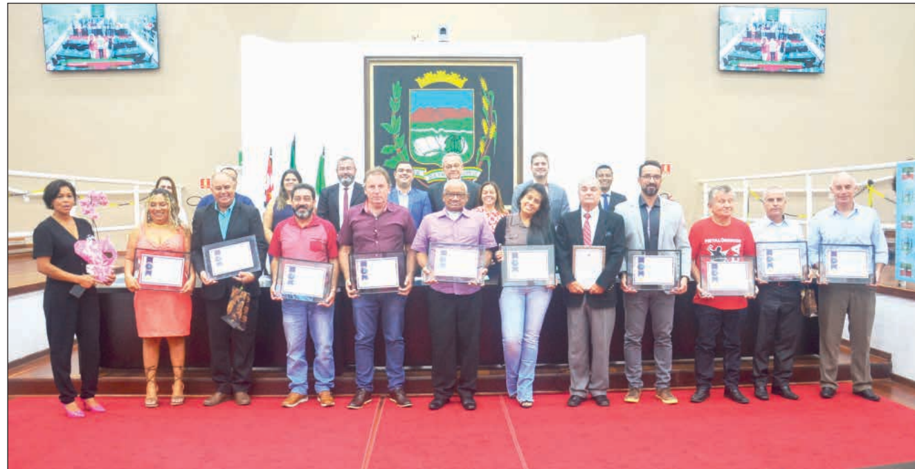
Metalúrgicos e metalúrgicas homenageadas, autoridades e vereadores na Sessão Solene em comemoração do Dia Municipal da categoria