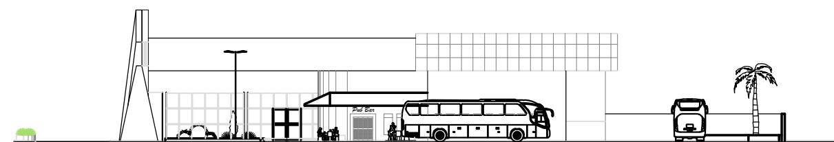
FACHADA LATERAL - VISTA DIREITA (F2)