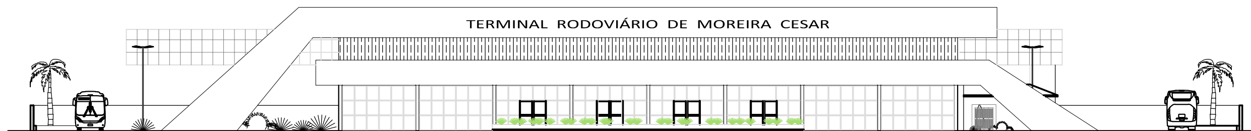
FACHADA PRINCIPAL - FRONTAL (F1)