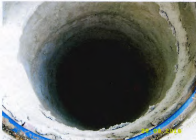
Detalhe do acabamento do PV