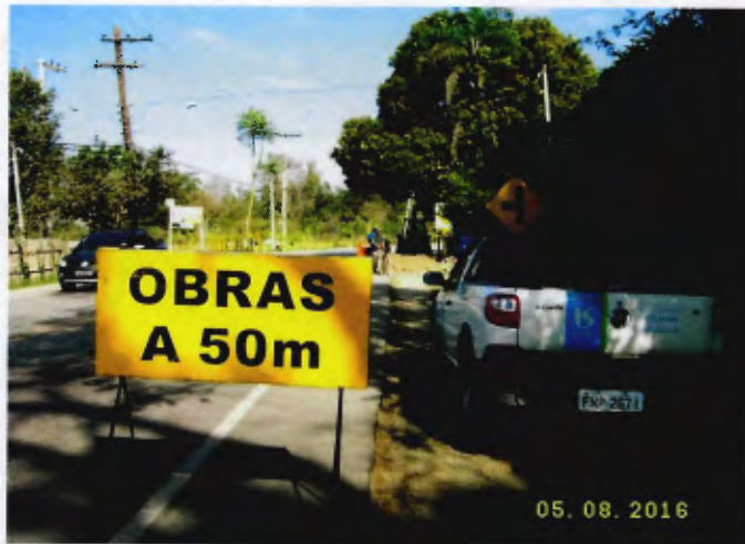
Detalhe do local inicio das obras