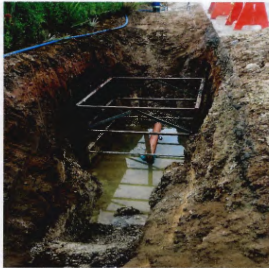
Detalhe do assentamento e escoramento do local