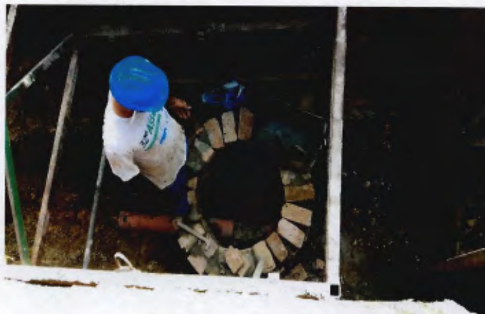
Detalhe da construção do PV (poço de visita)