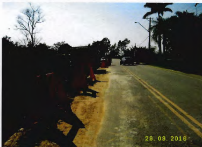
Detalhe da sinalização