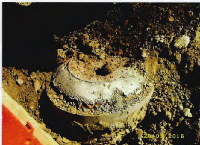
Detalhe de PV acabado