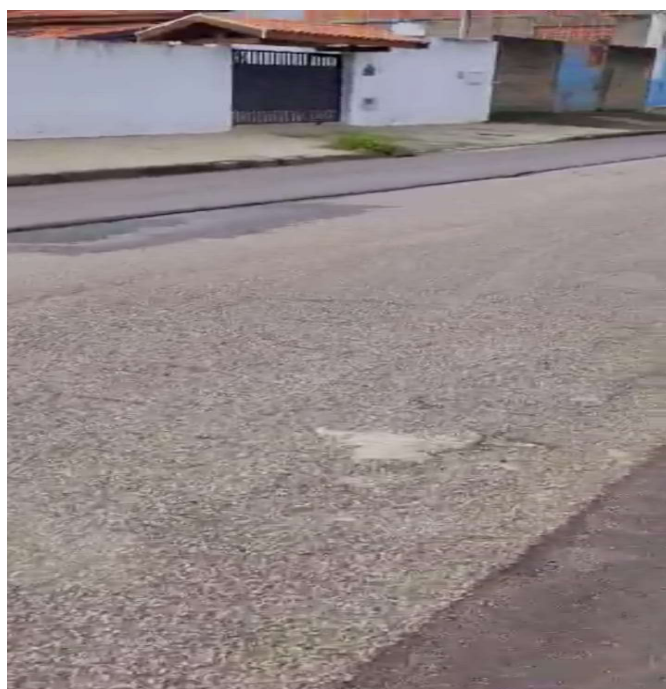
FOTOS ENVIADAS POR MUNÍCIPE ONDE DEMONSTRA DIFERENÇA DE NÍVEL DO PAVIMENTO ASFÁLTICO (DEGRAU).