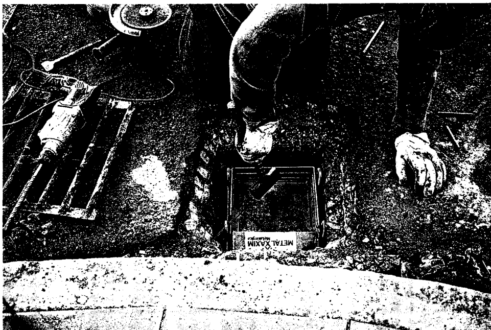
Instalação de dispositivo anti-odor