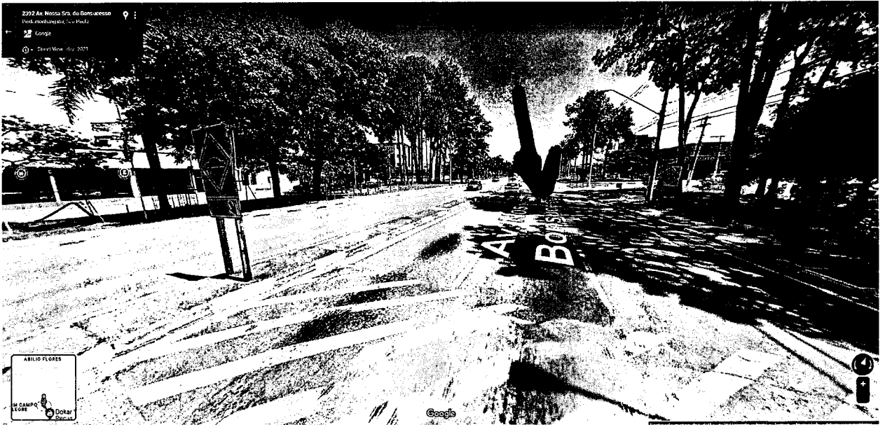
Avenida Nossa Senhora do Bom Sucesso, altura do nº 2392.