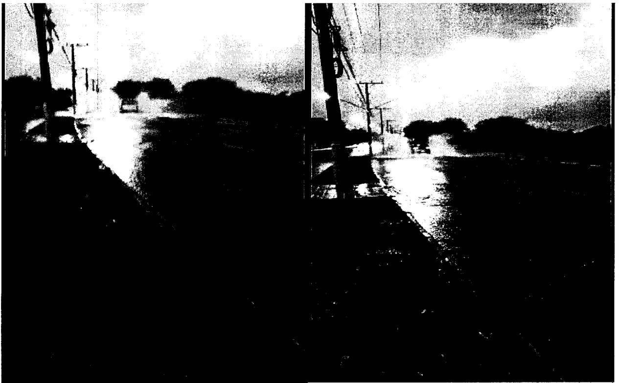
Fotos de veículos passando pela avenida totalmente alagada. 04 de dezembro de 2021