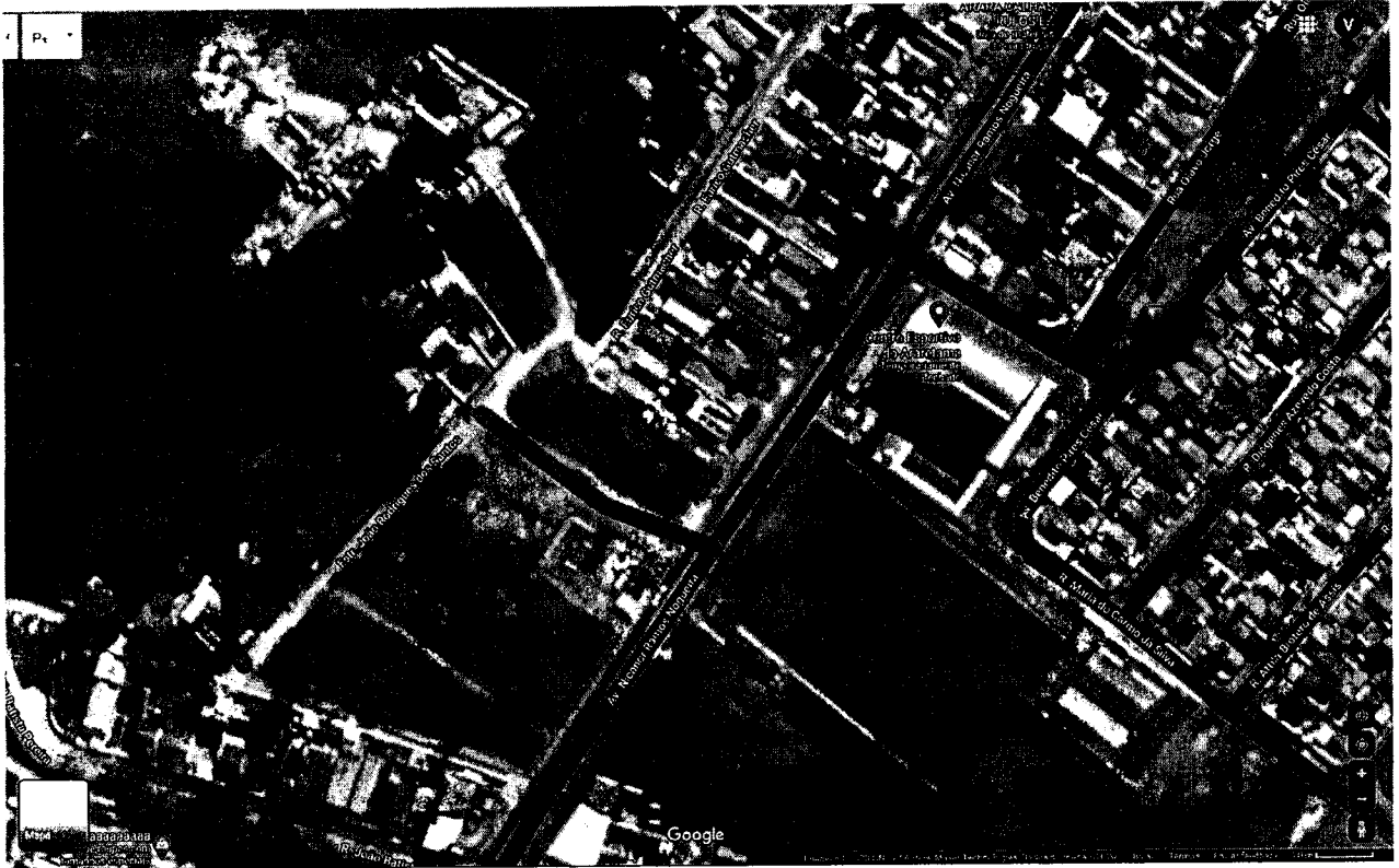
Acima Estrada João Rodrigues dos Santos (1) e Rua Eurico Gutmacher (2) no bairro residencial Araretama.