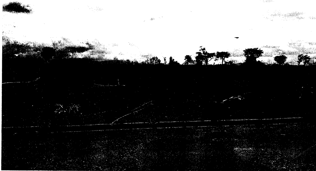
Area propicia para a instalação de vários equipamentos para a comunidade