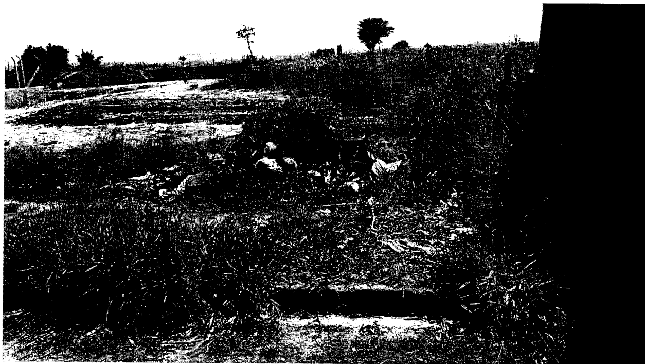
Lixos e entulhos começam a ser descartados de forma irregular