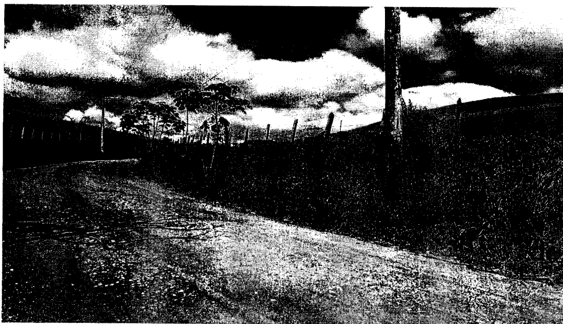
Proprietário solicita alterar dreno para próximo do poste acima