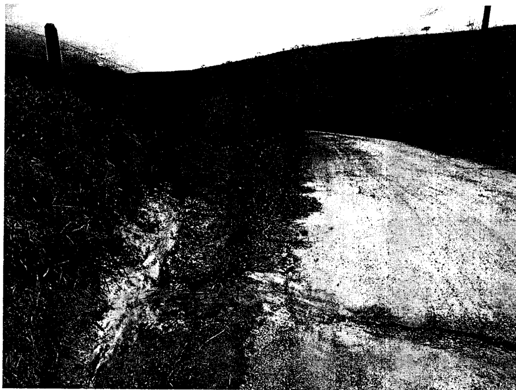
Acima dreno de água pluvial