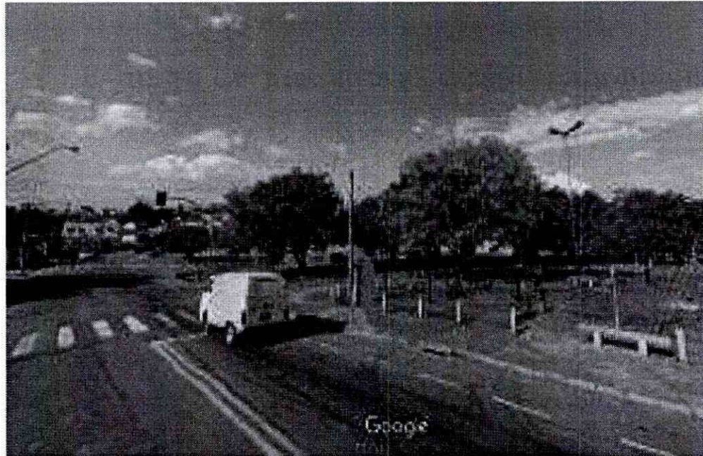
FOTO DO LOCAL