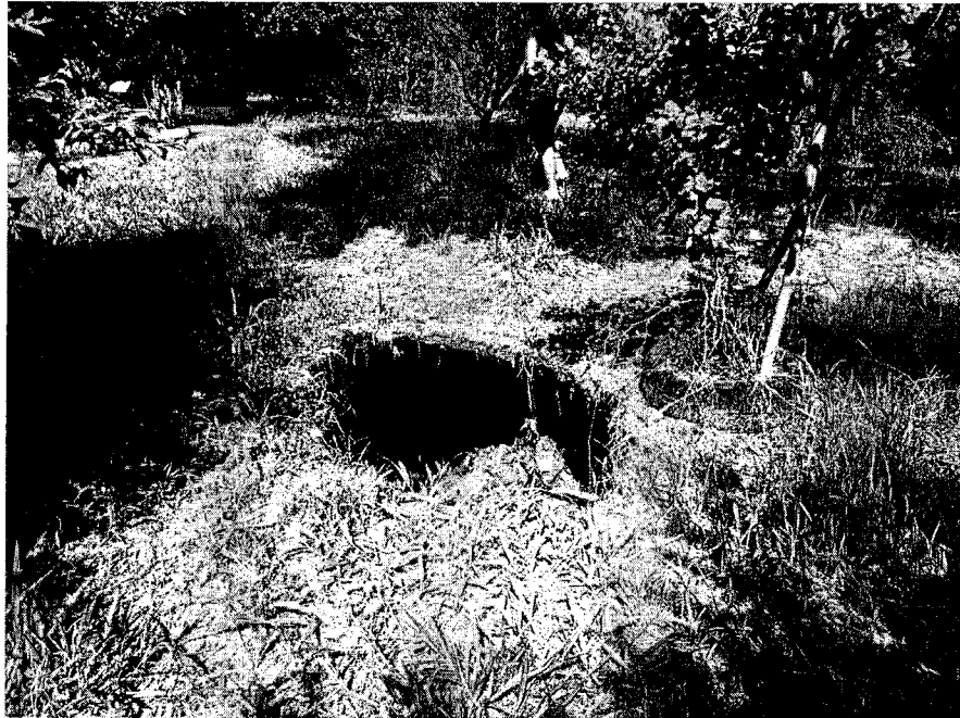
BURACO DENTRO DA ÁREA VERDE