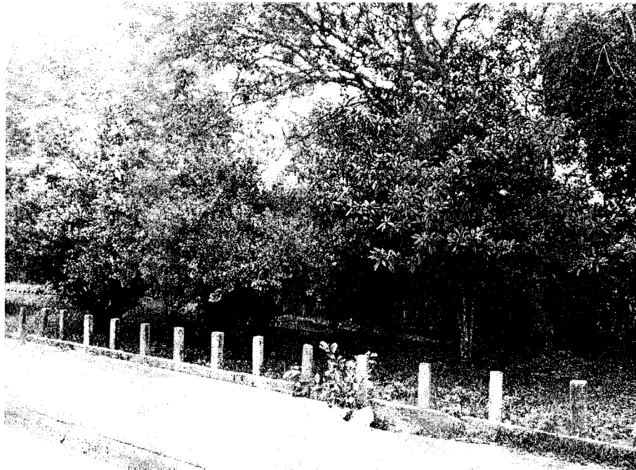
CALÇADA DA ÁREA VERDE E POSTES DE CONCRETO DANIFICADOS