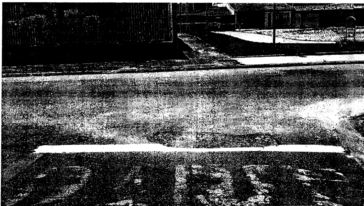
Buraco no asfalto localizado na Rua Uruguai x Rua Áustria, frente praça do Pasin