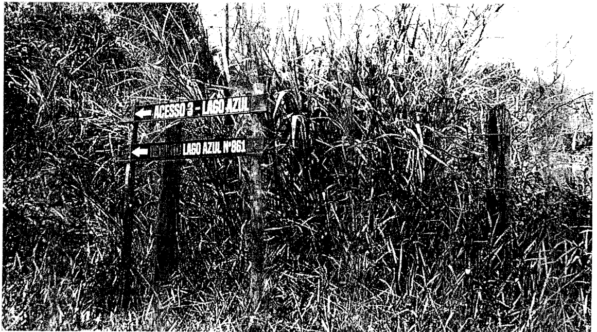
Acesso 3 – Lago Azul Rural