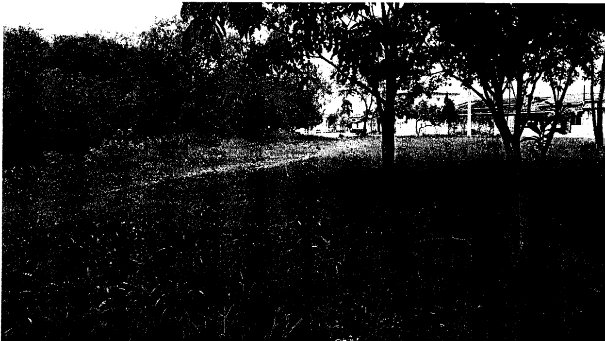
Área localizada entre os bairros do PASIN X MANTIQUEIRA