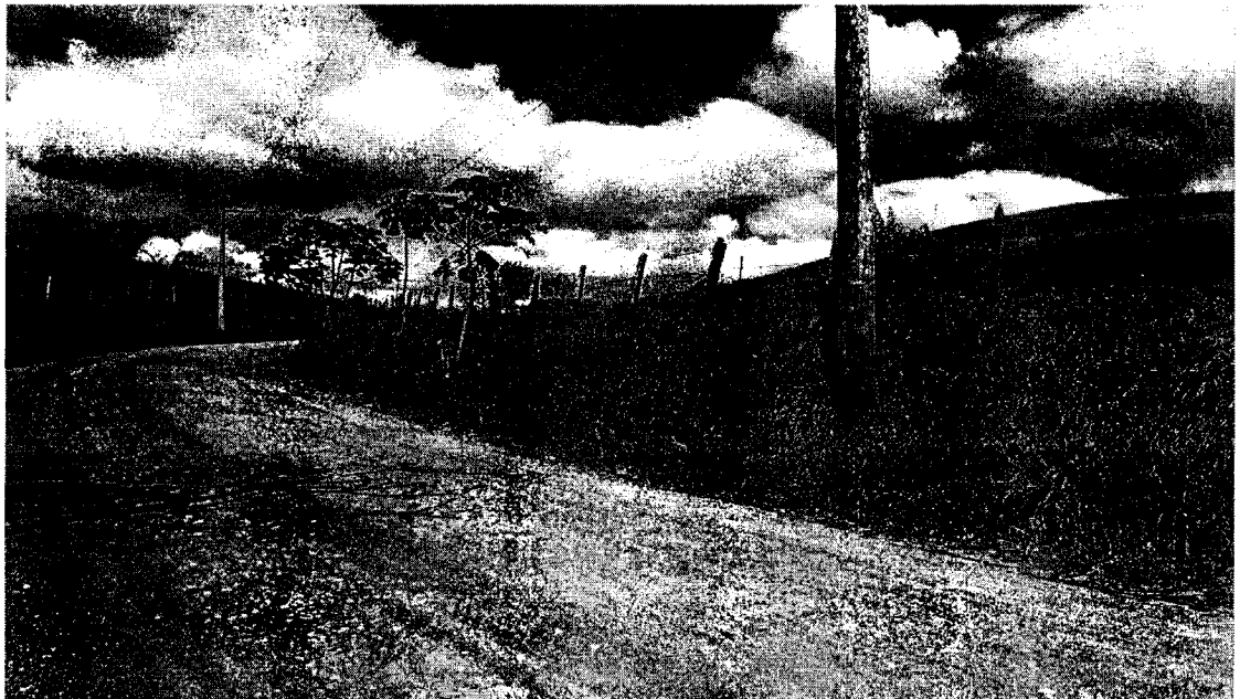
Proprietário solicita alterar dreno para próximo do poste acima