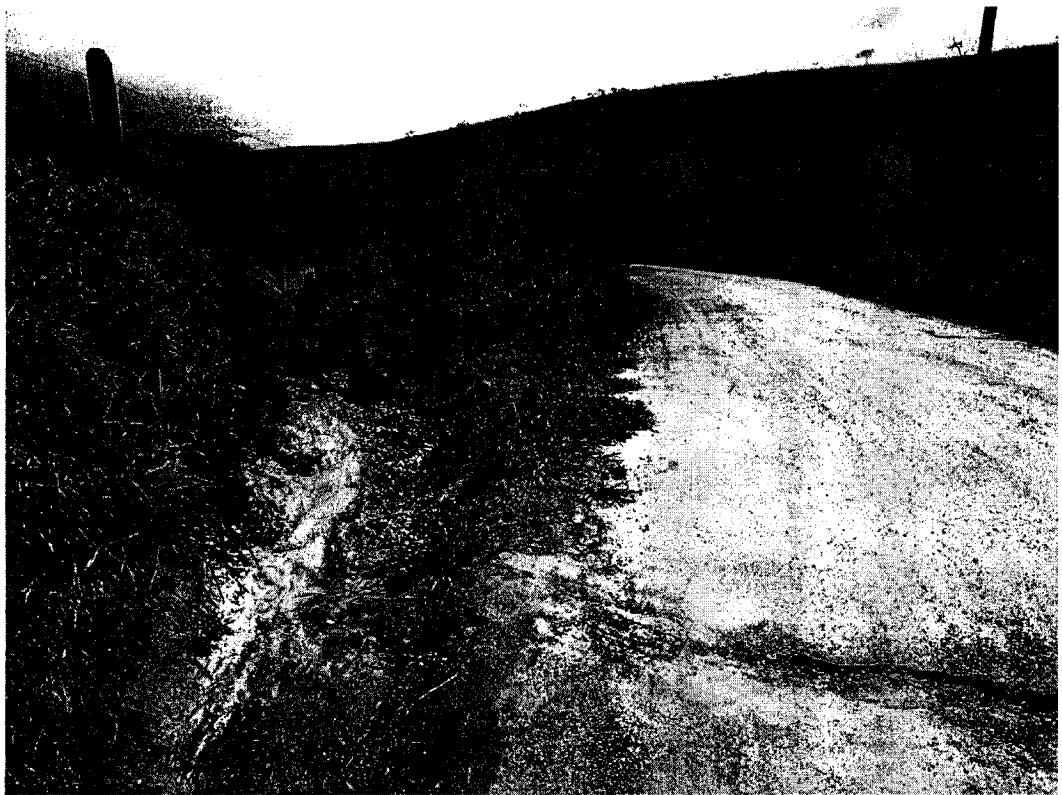
Acima dreno de água pluvial