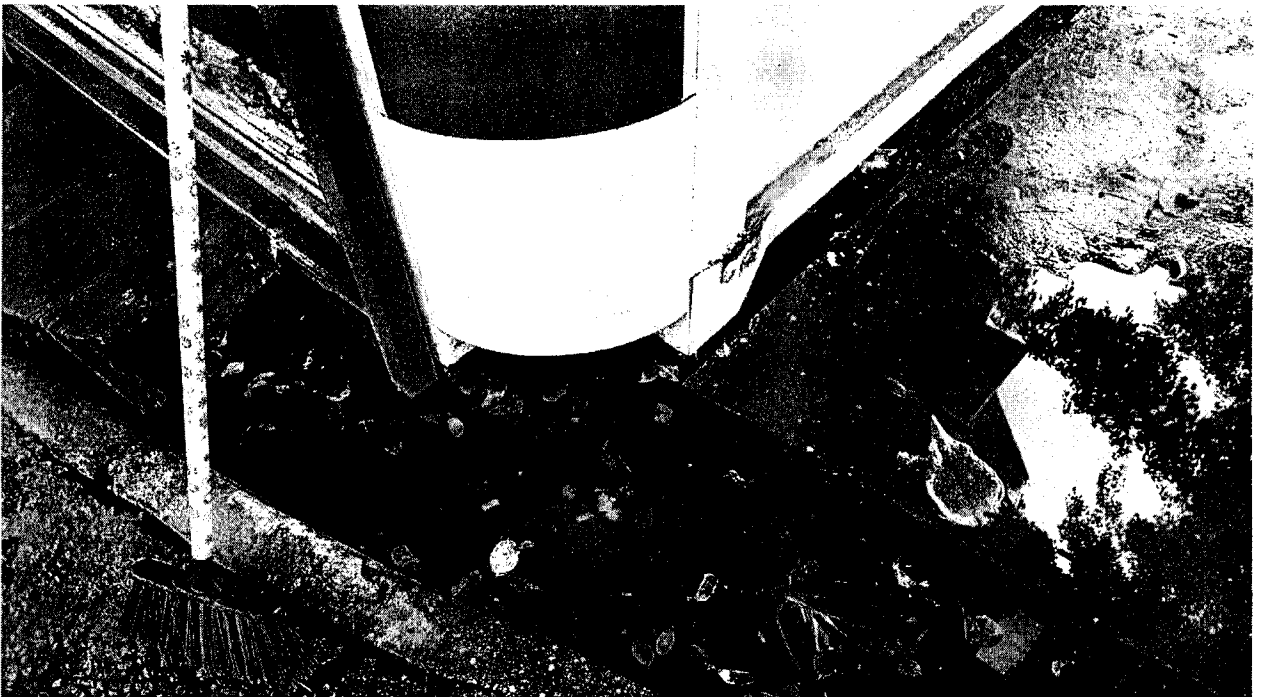
Água empoçada pois não tem saída para escoamento