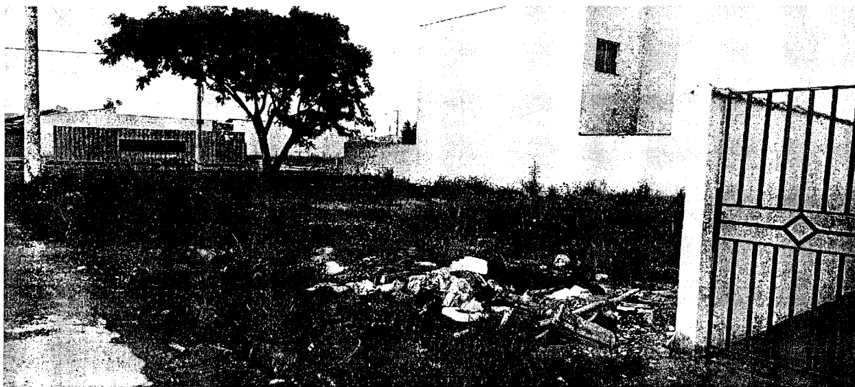
Av. Polônia – Pasin – Terreno de esquina, tomado por mato alto e com descarte de entulhos e lixos