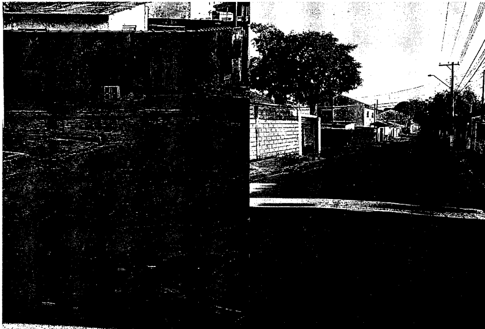
Rua Vicente de Paula, bairro do Santana – rua toda retalhada e buracos.