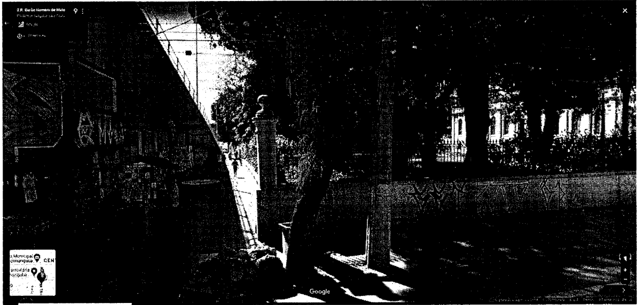
PARTE QUE É FECHADA EMBAIXO DO VIADUTO