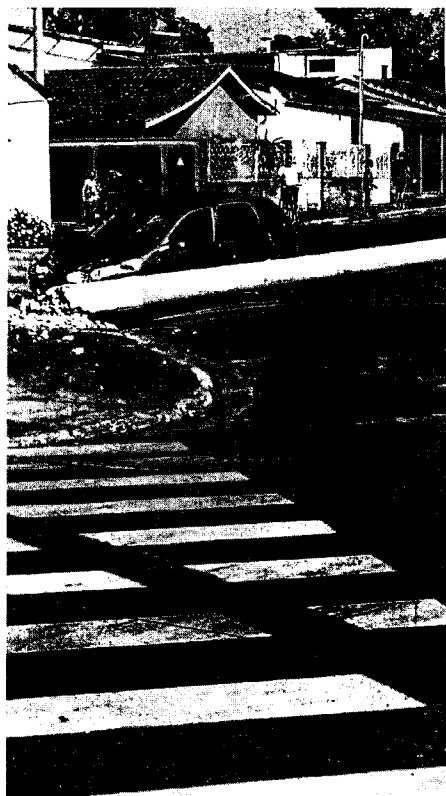
Foto 1 – Poste derrubado após colisão de veículo – Rua Antônio Ramos (Vila São José)