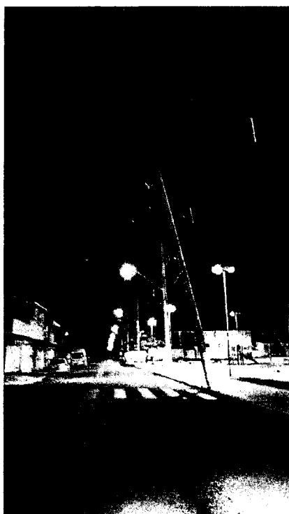
Foto 2 – Poste avariado (toro) com risco de cair , Rua Áustria, frente praça do Pasin