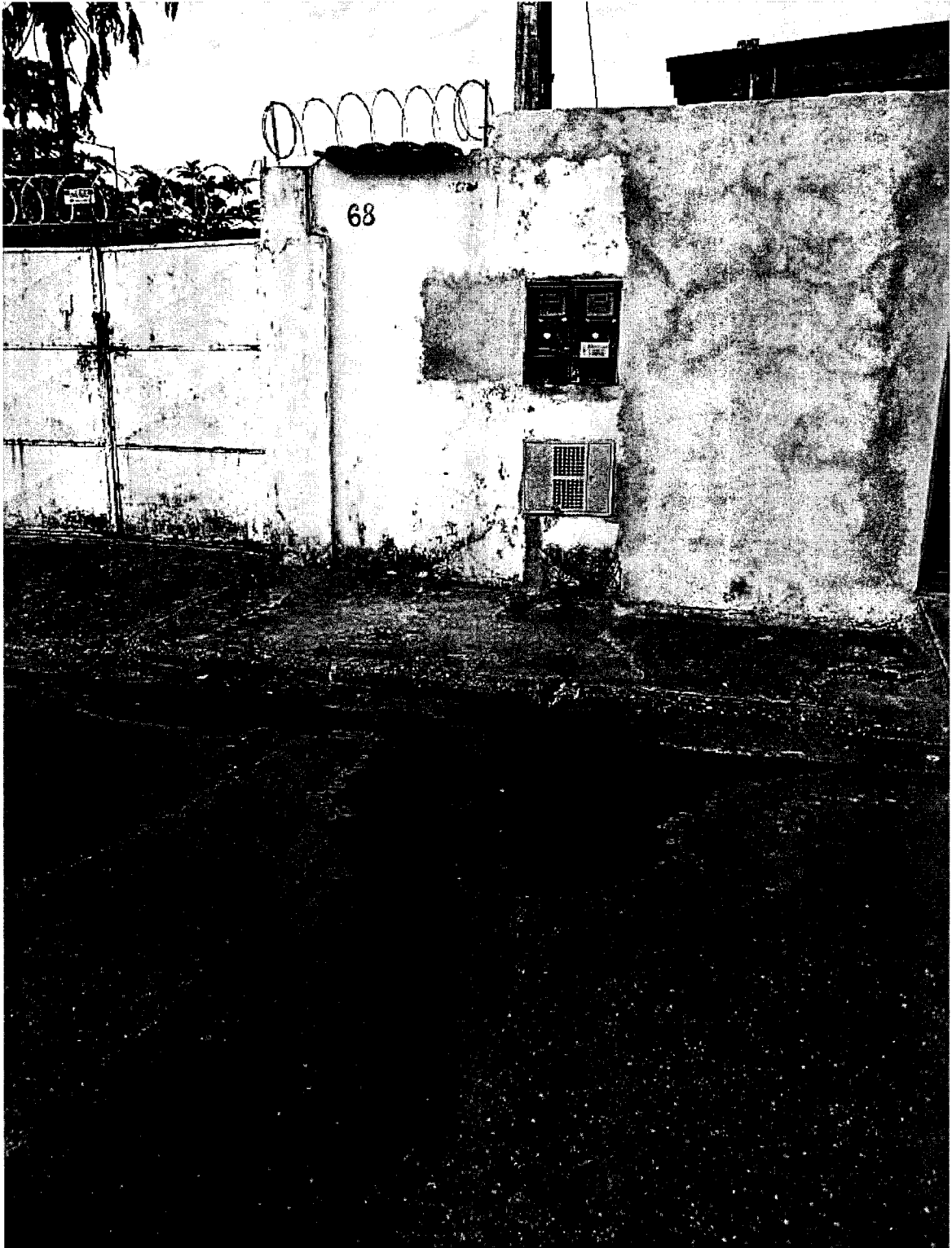
Rua Karumã em frente ao número 68, bairro Maricá