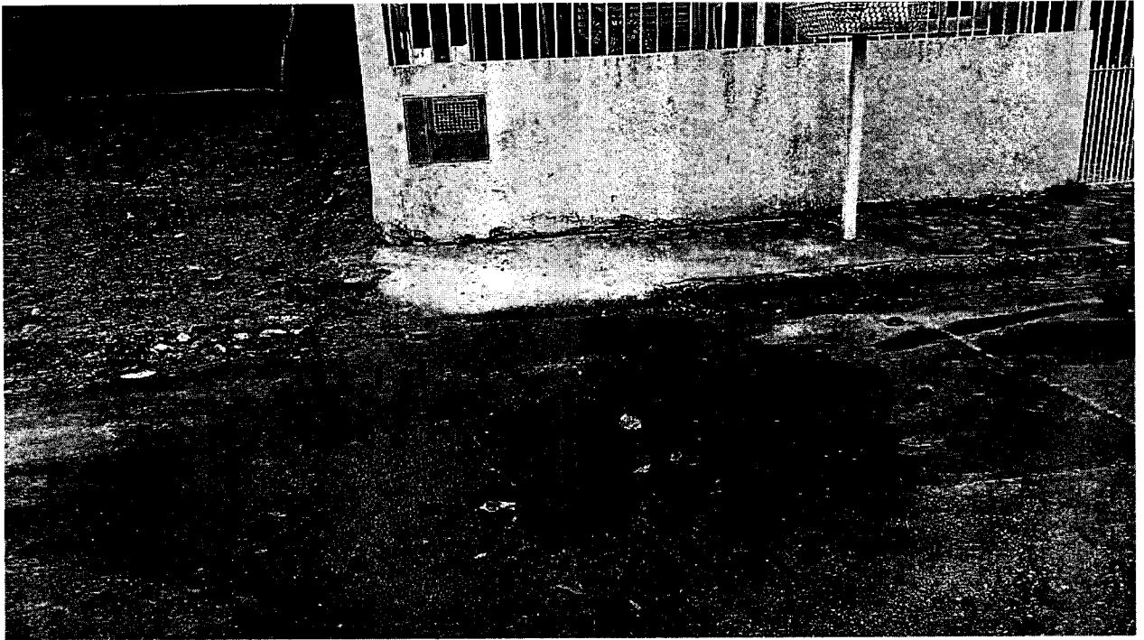
Rua Karumã em frente ao número 118, bairro Maricá