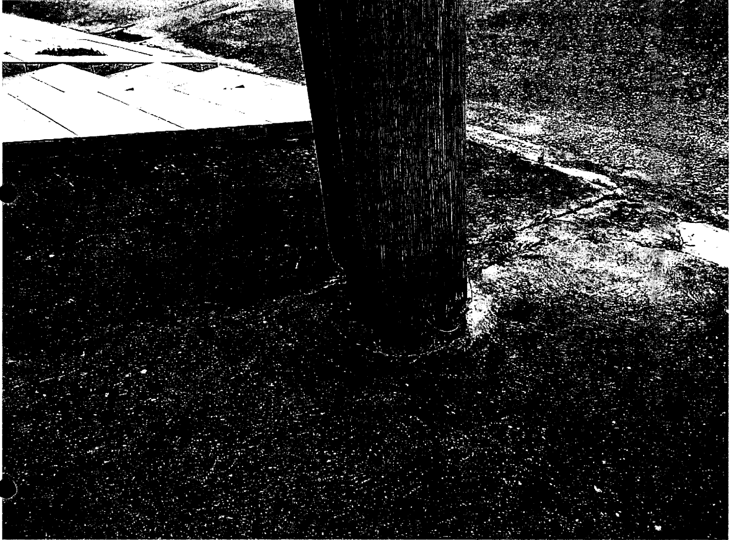
Troca do poste na Av Paraná em frente a residência 730, bairro Maricá