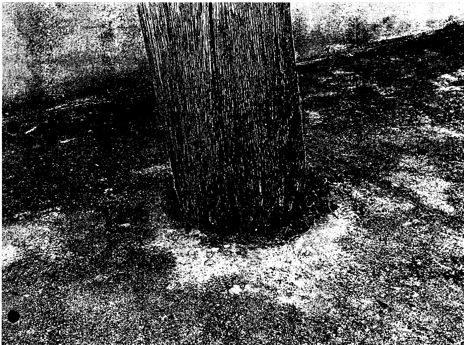
Rua Benedito Durval Pestana Barbosa em frene ao número 34, bairro Maricá