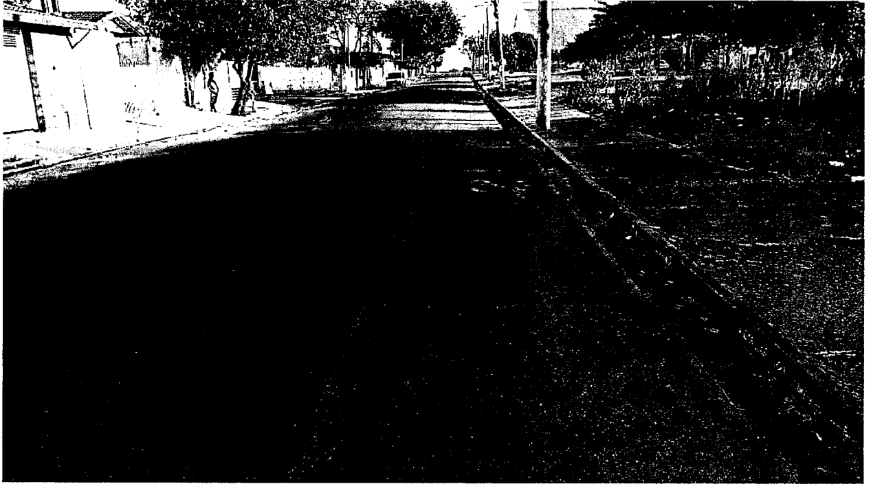
Ciclofaixa encontra-se totalmente apagada