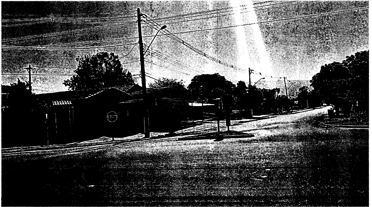
Foto do “trevo” localizado na SP62, entrada do bairro Taipas, em Moreira César, local que precisa receber o asfalto.