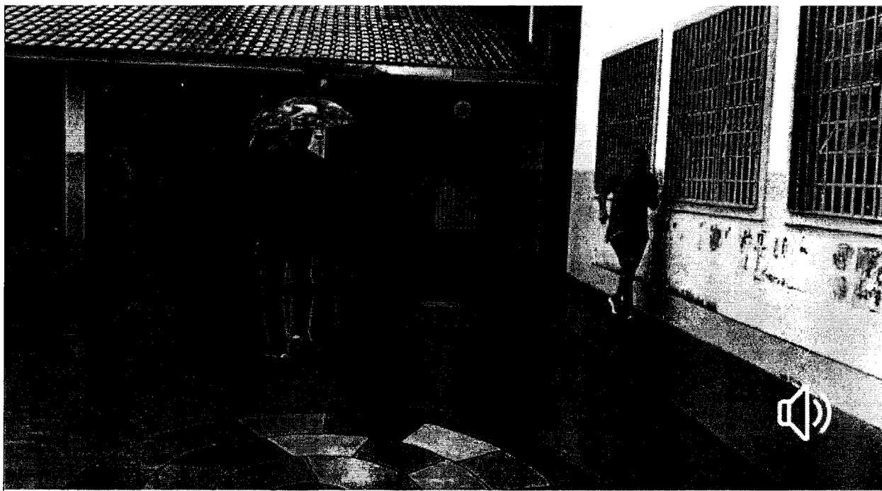
Pai de aluno com filho no colo em dia de chuva, atravessando o pátio para acesso a sala de aula, com risco de escorregar