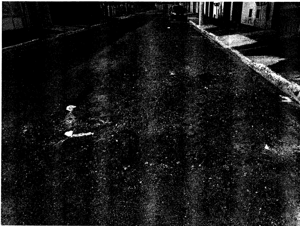
Rua Adair Ferreira Macedo, no Vista Alegre – Feital.

Rua foi retalhada para passagem de tubulação e até o momento não foi consertado.