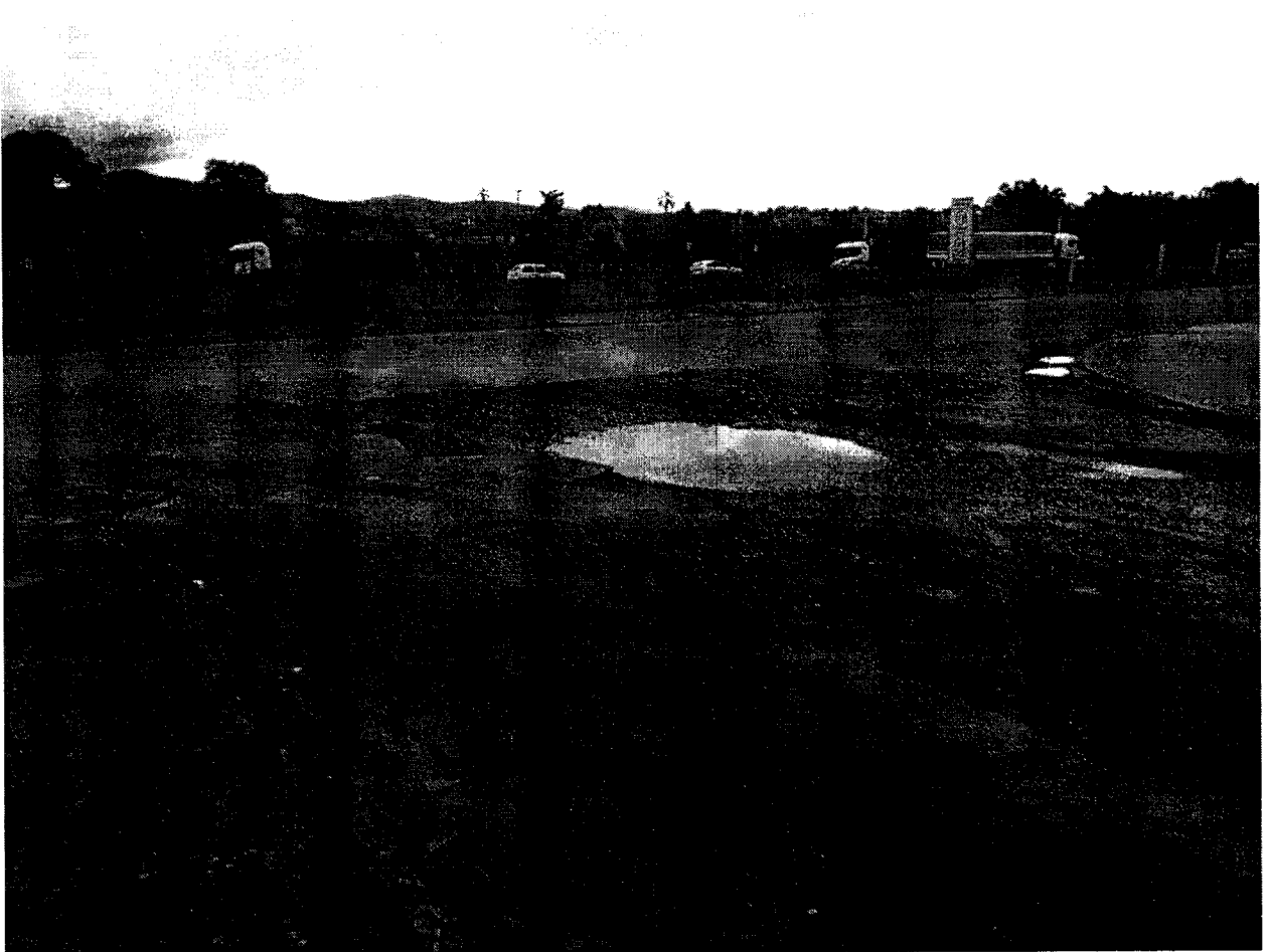
Cruzamento Rua Paraibuna com a Avenida Independência