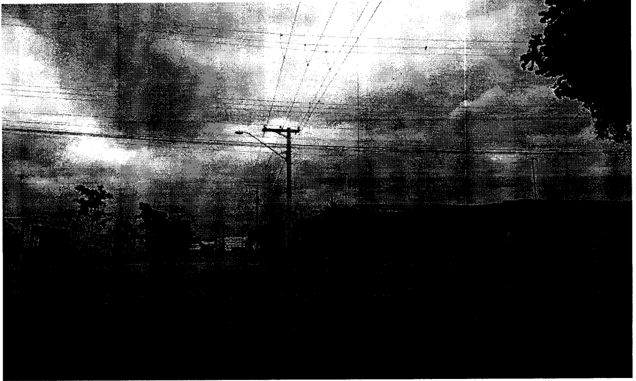
Cruzamento Rua Paraibuna com a Rua Princesa Isabel