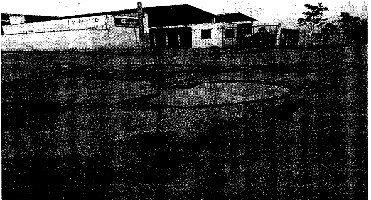
Cruzamento Rua Paraibuna com a Rua Princesa Isabel