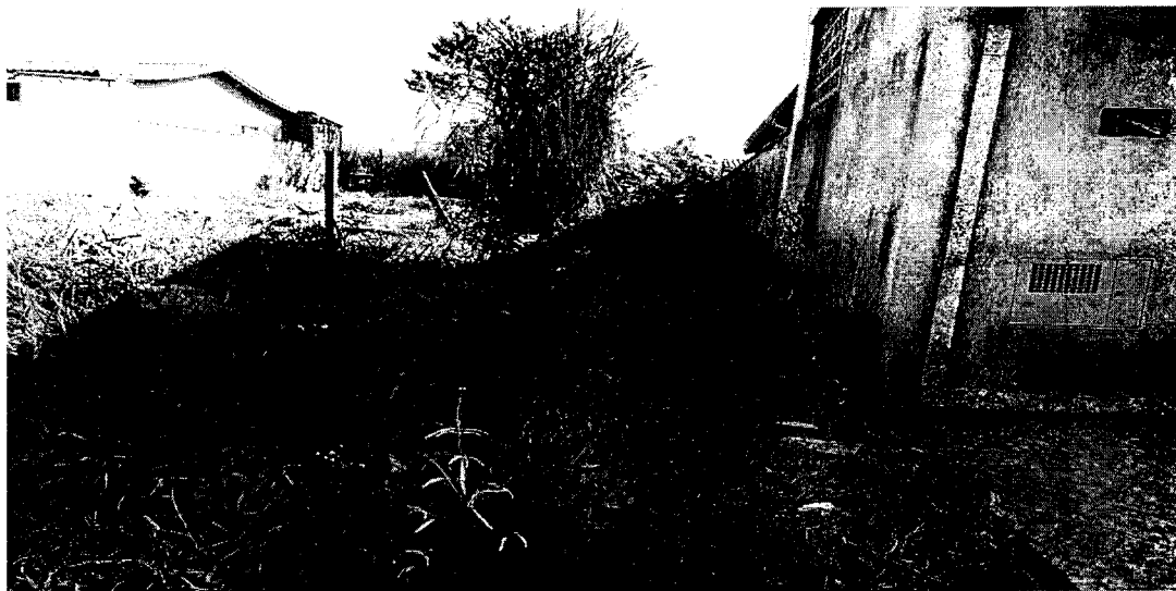
Terreno tomado por mato alto