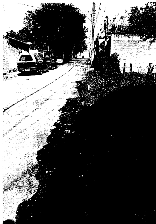
Calçada com mato alto