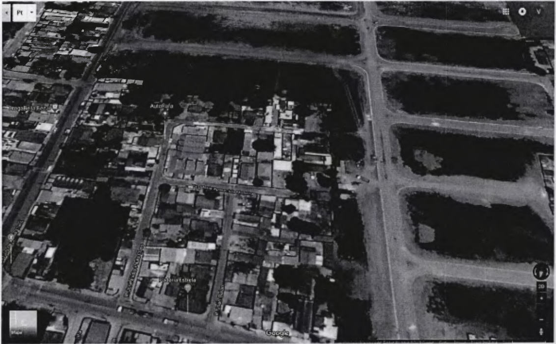
Área localizada nos fundos da Rua José Elidio de Paula Claro, no bairro Feital.