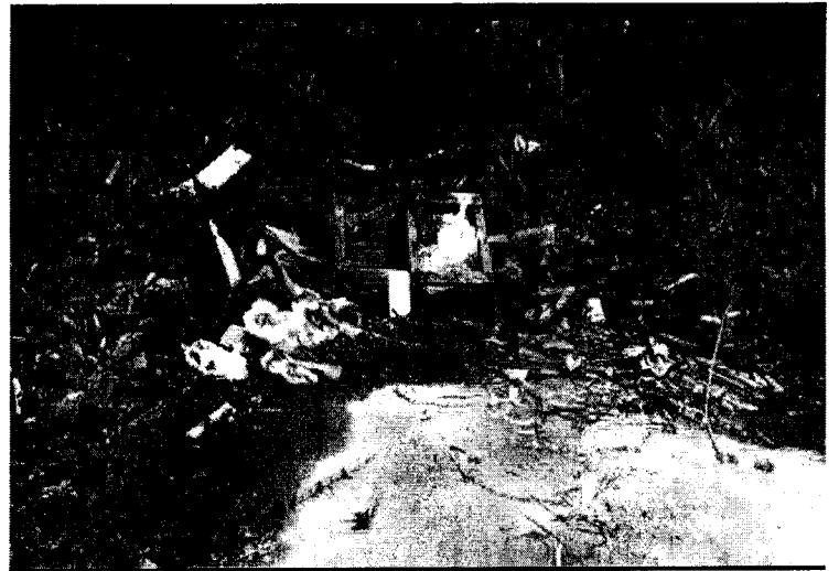
Rua Joaquim Ramos da Silva, na Vila São Benedito. Final da rua tomada por mato alto e lixos.