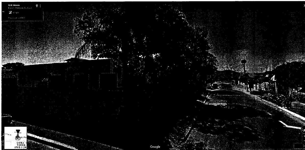
Prédio que abrigou o SESI na Rua Venezuela x Rua México, na Vila São José.