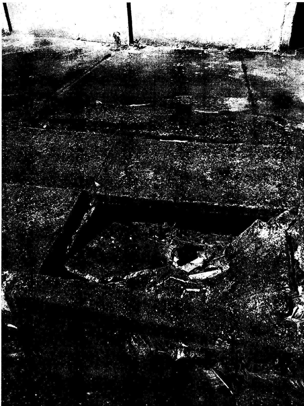
Tampa de Bueiro quebrada – localizada na Rua Sargento Aristides Vasconcelos, no Residencial Campos Maia. - frente ao Centro Comunitário