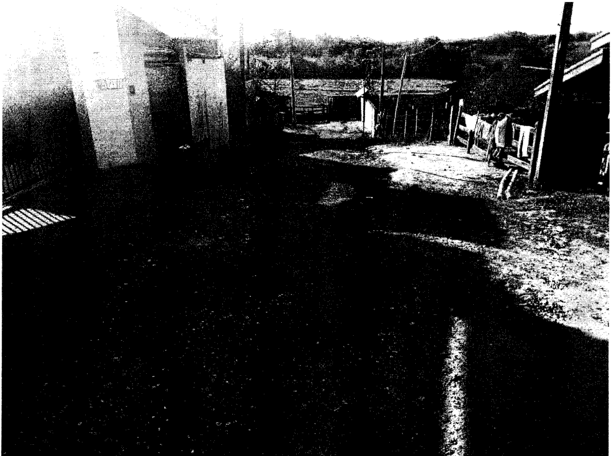
Vista do final da rua ainda de terra e estado precário com buracos.