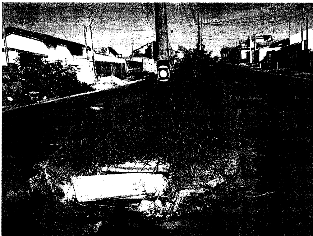
Tampa de Bueiro quebrada - Avenida José Monteiro Romão