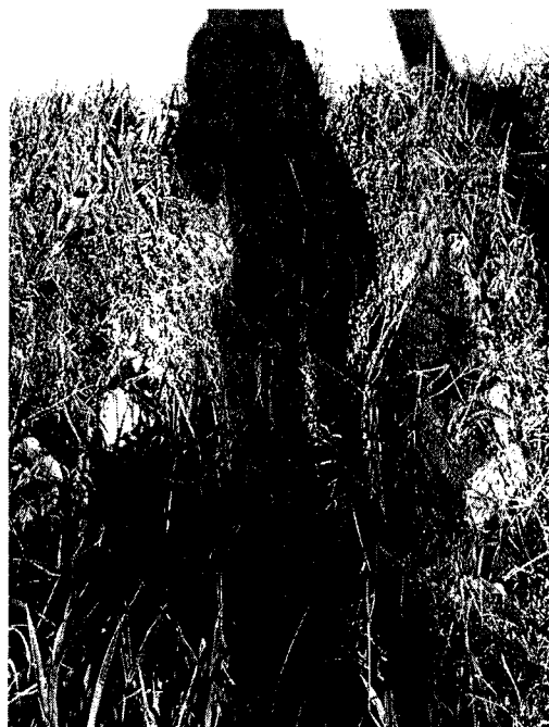
Tampa de bueiro quebrada e tomado por mato alto - Rua Inácio Batista - Mantiqueira