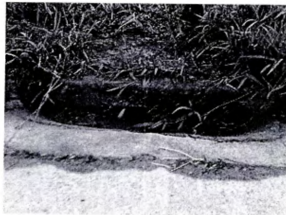
2- Todas as bocas de lobo estão obstruídas por mato e terra