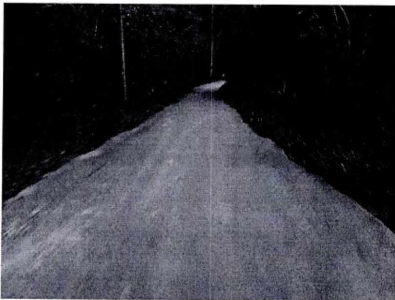
1- Margens da estrada esta tomada por mato alto dos dois lados