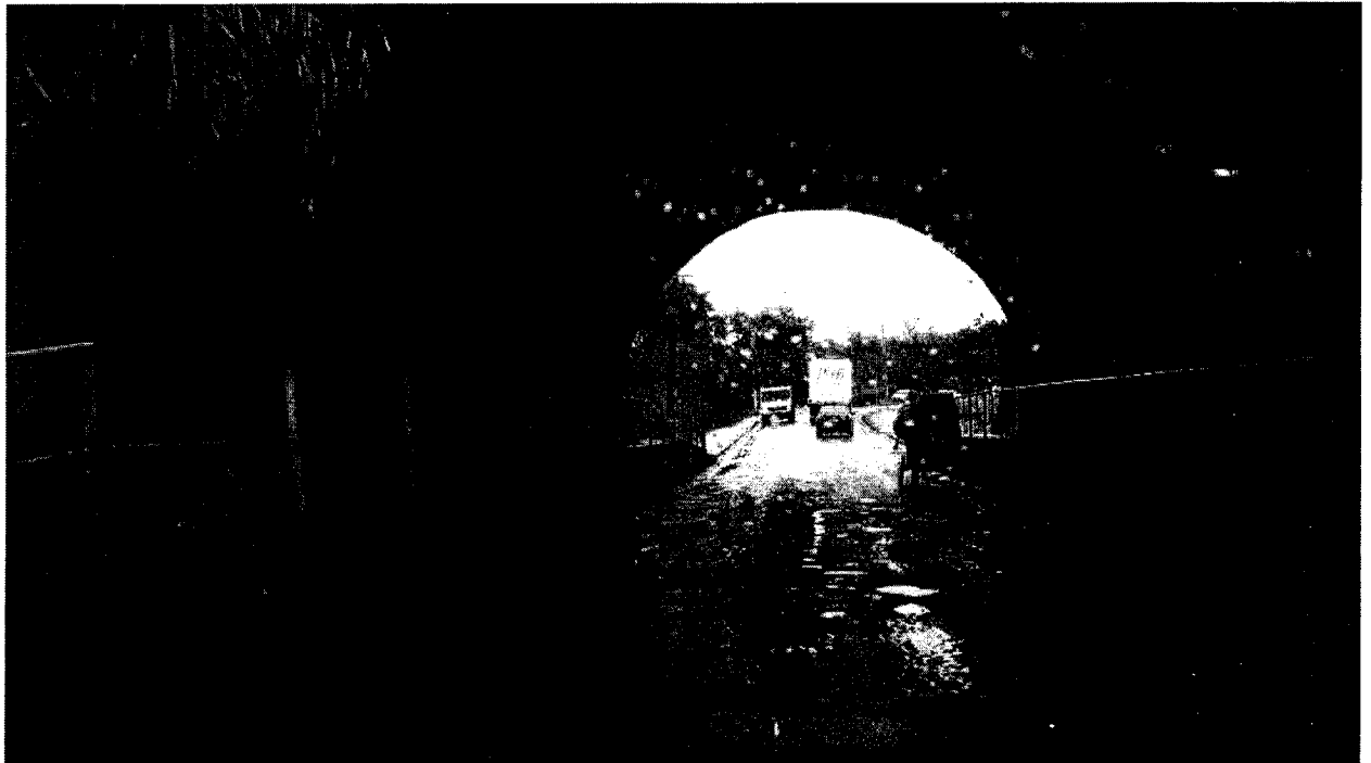
Tunel do Castolira

Diversos buracos no referido local esta causando transtornos e prejuizos aos motoristas.