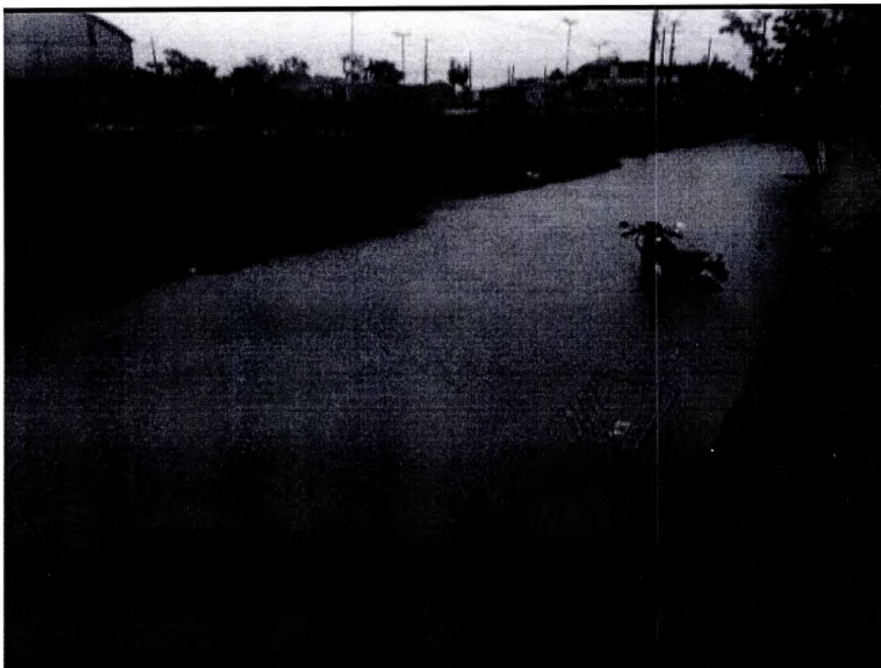
Rua Geraldo Mario do Sacramento, no bairro das Campinas