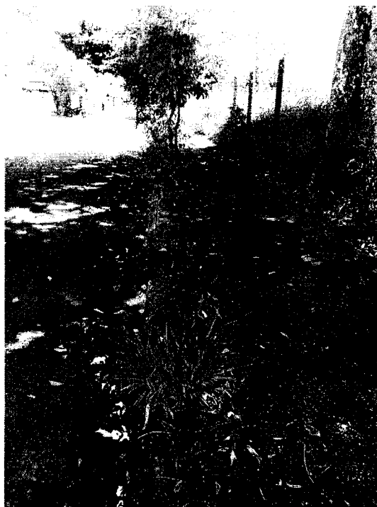
Calçada paralela a estrada de ferro com mato, precisa de capina e varrição.