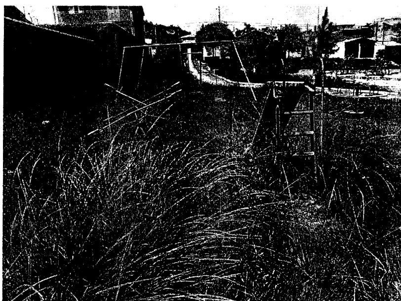
Parquinho tomado por mato alto