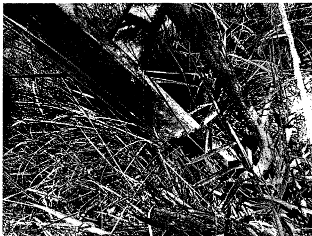
Base do brinquedo tomado por ferrugem