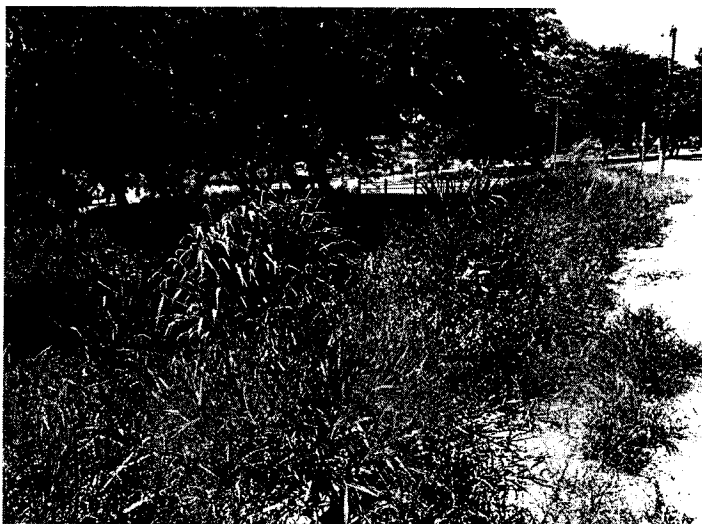
Margens do córrego tomado por mato alto (paralelo ao campo de futebol)