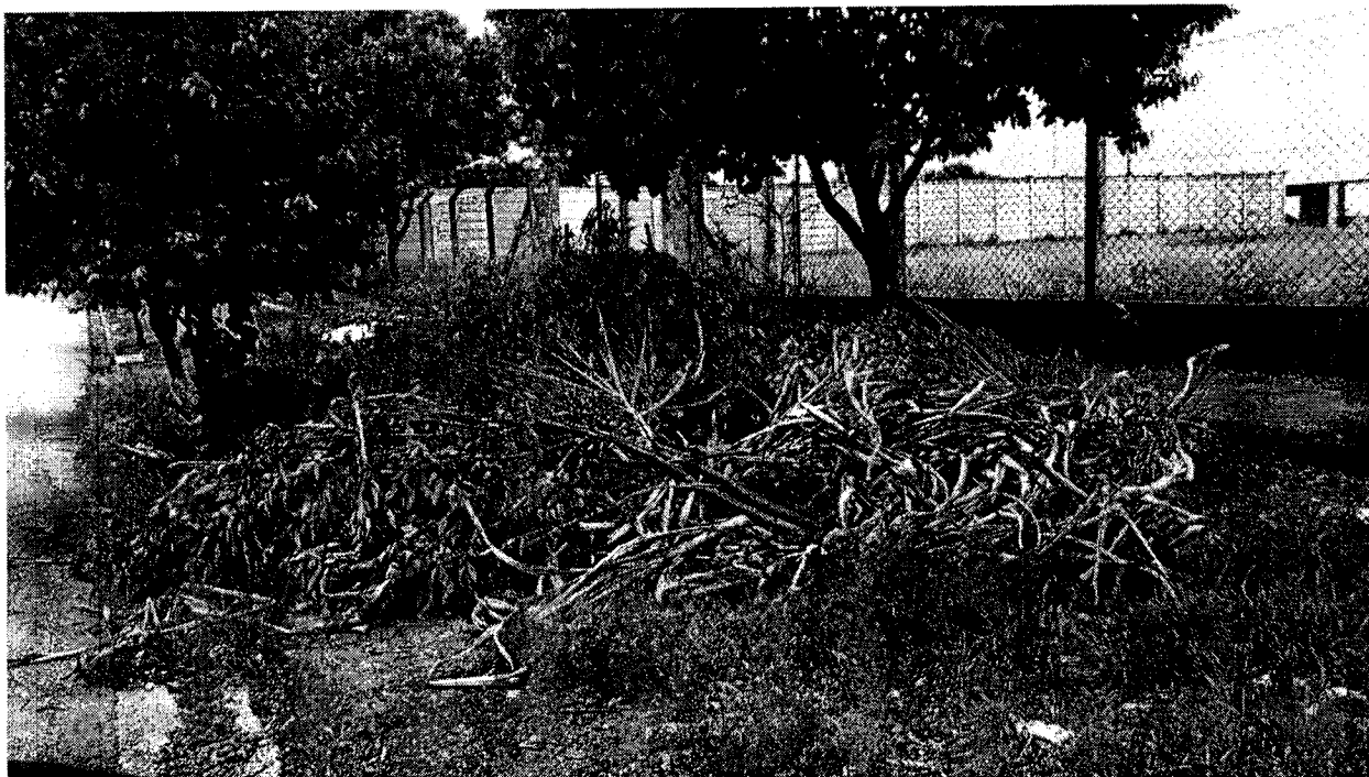
Em frente nº 12