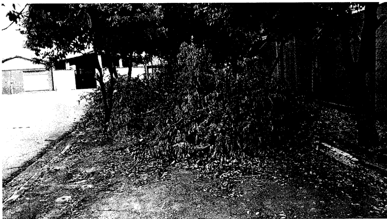
Em frente nº 25