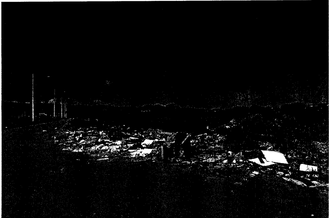
Alameda dos Manacas -Local utilizado para descarte irregular de lixos e entulhos