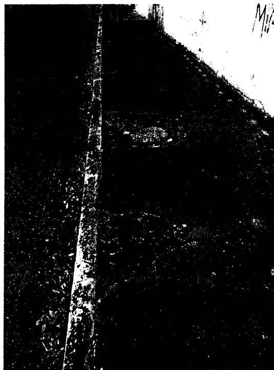
2-calçada com buracos com risco de causar acidentes