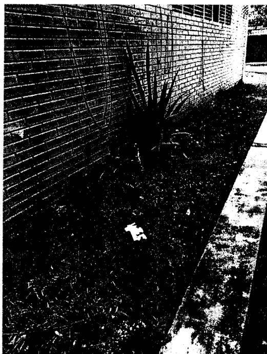
3-Jardim e revestimento de parede precisam de revitalização