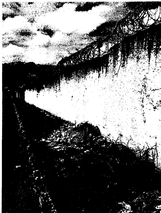
1- Calçada obstruída com lixos e entulhos, mu- mo precisa de pintura