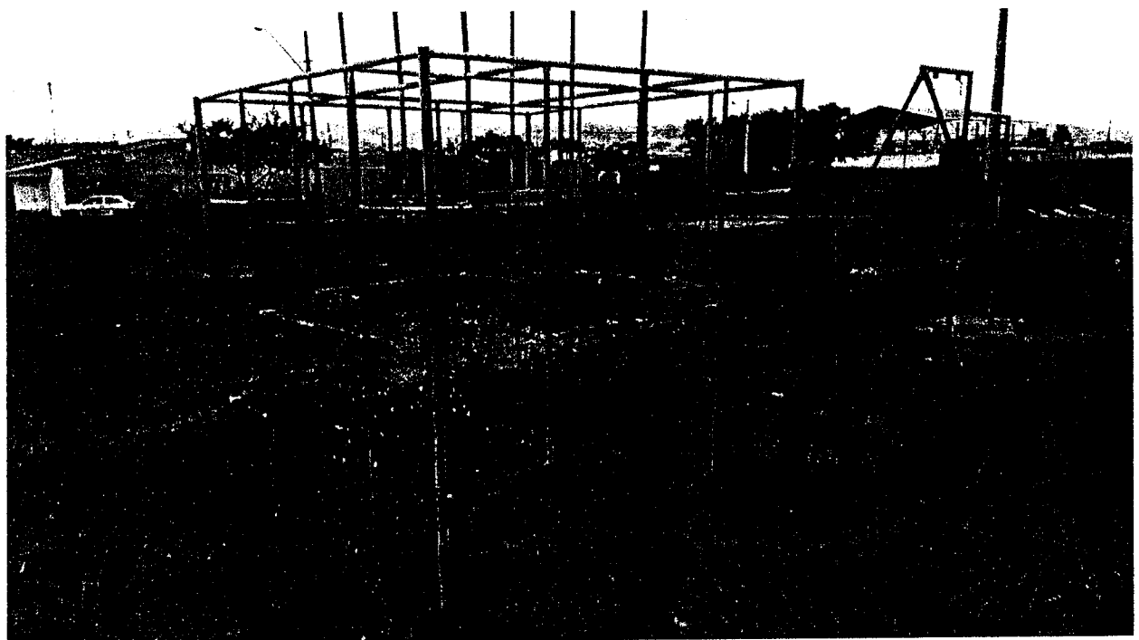
Parquinho Infantil e Academia Melhor Idade – AMI – bairro Terra dos Ipês I – Setor Sul Brinquedos e aparelhos quebrados, enferrujados e com pintura desgastada