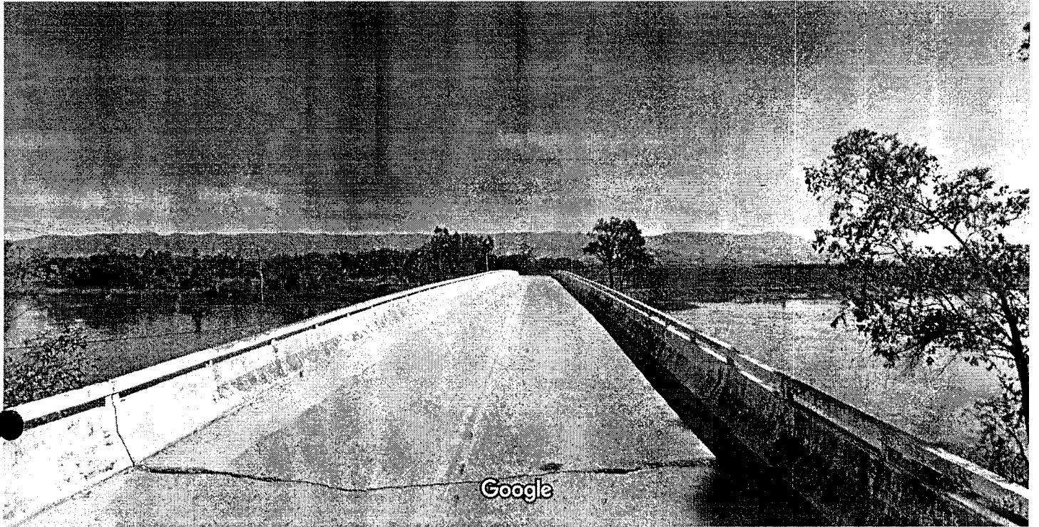
Captura da imagem: set 2011