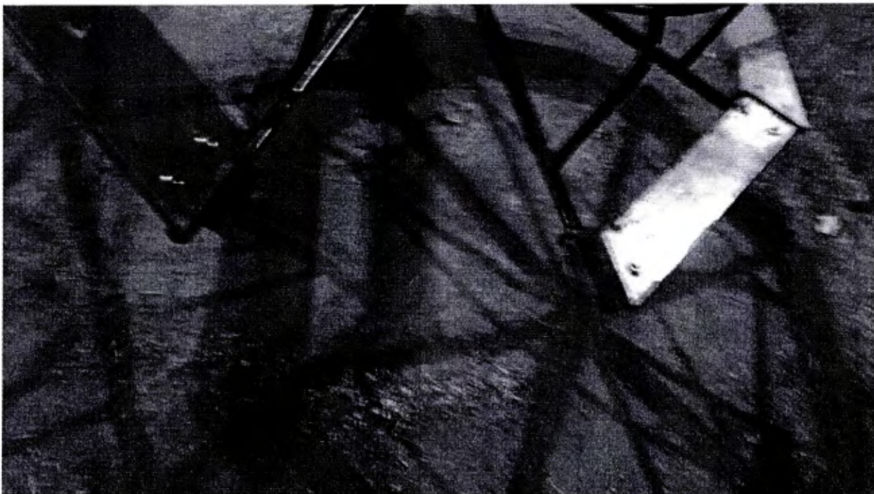
Brinquedo parquinho infantil quebrados