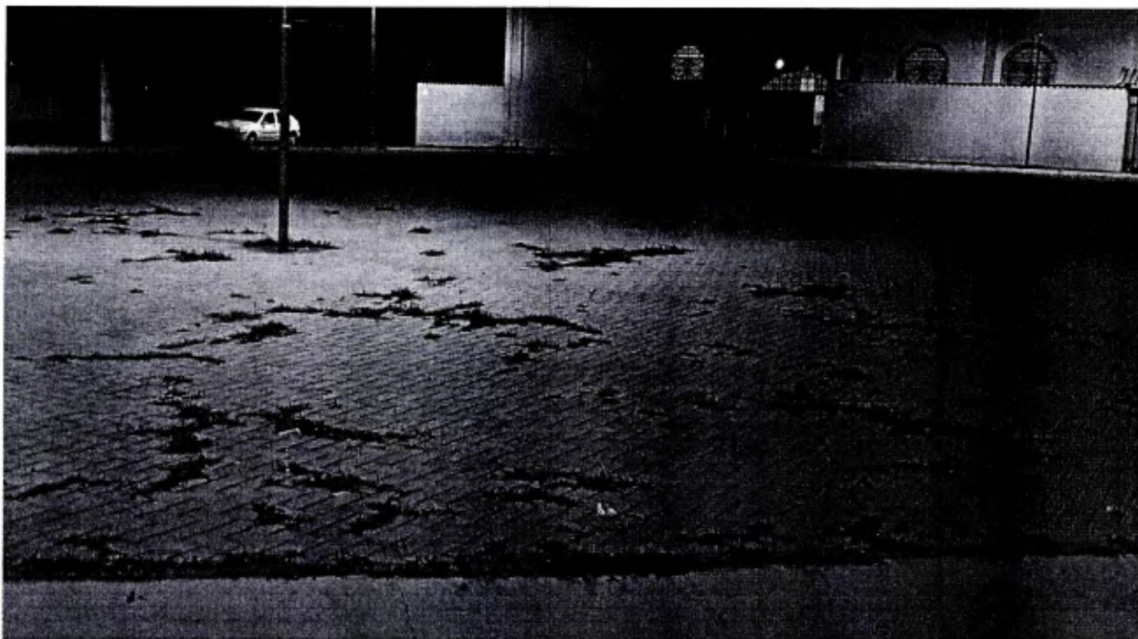
Piso intertravado tomado por mato