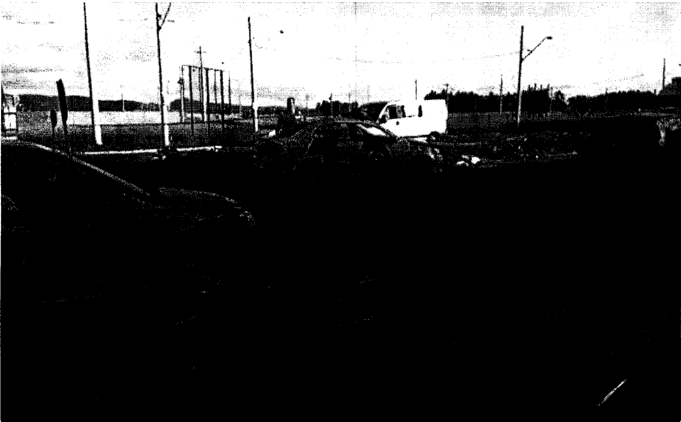
Ciclista morre e motociclista fica gravemente ferido em acidente em Pinda

Por G1 Vale do Paraíba e região 10/04/2017 18h48 · Atualizado 10/04/2017 18h48